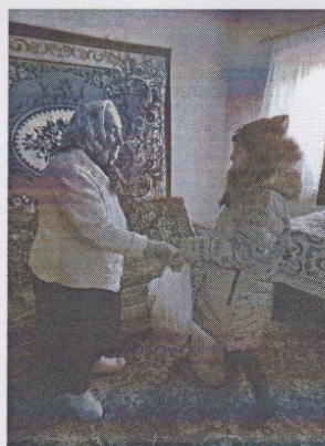
Рисунок 4. МБОУ «Волоконовская СОШ № 2»