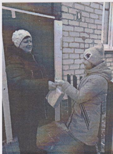
Рисунок 2. МБОУ «Тишанская СОШ»