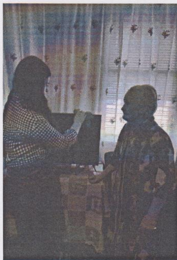
Рисунок 1. ОГБОУ «Пятницкая СОШ»

Подготовлен фото отчет о проведении акции.