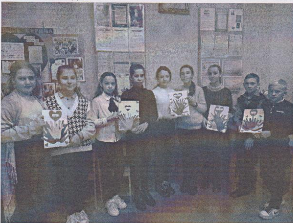
Рисунок 6. Обучающиеся МБОУ «Ютановская СОШ» подготовили подарки, выполненные своими руками, пожилым людям.

Методист, педагог дополнительного образования МБУ ДО ЦДТ «Ассоль», ответственный за блок