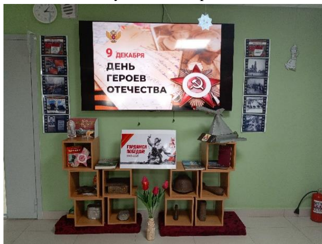
Рис. 1 МБОУ «Покровская СОШ»

Оформление патриотических пространств позволило создать условия для формирования у обучающихся патриотических чувств через уважительное отношение к историческому прошлому своей страны; активизировало познавательную, творческую, социальную деятельности детей по изучению истории Великой Отечественной войны.