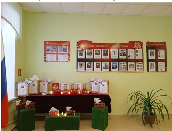
Рис. 6 МБОУ «Погромская СОШ»