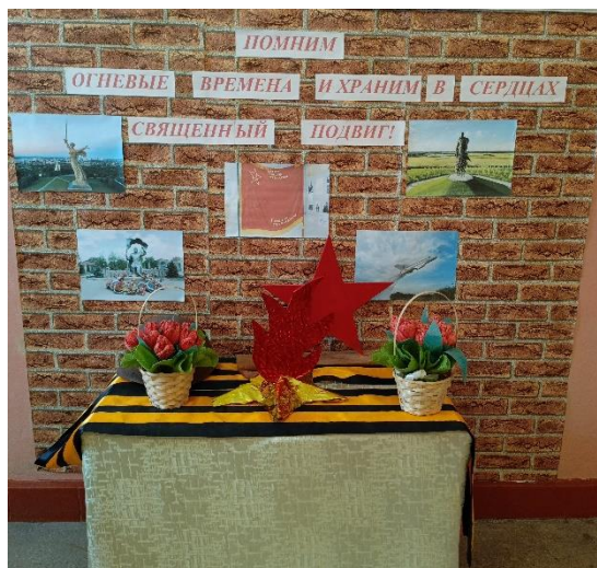
Рис.10 МБОУ «Репьевская ООШ»