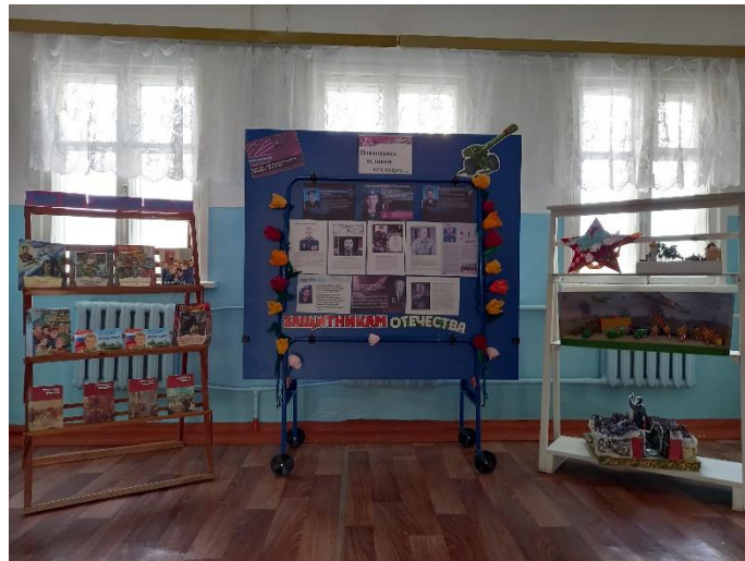
Рис.11 МБОУ «Афоньевская ООШ»