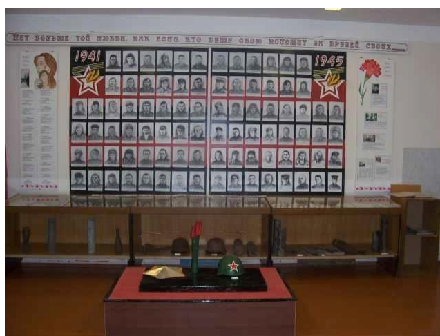
Рис. 15 МБОУ «Тишанская СОШ»