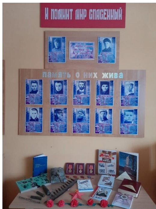
Рис.9 МБОУ «Староивановская СОШ»