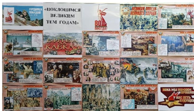
Рис. 8 МБОУ «Фощеватовская СОШ»