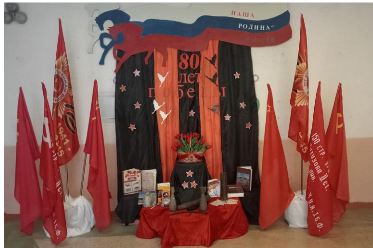
Рис. 2 МБОУ «Волчьё – Александровская СОШ»