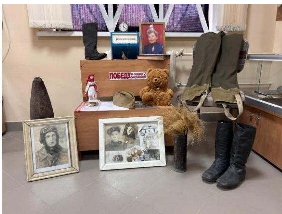
Рис. 5 ОГБОУ «Пятницкая СОШ»