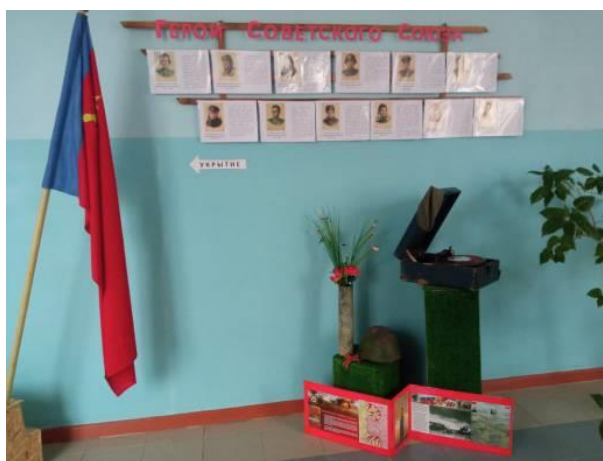
Рис. 16 МБОУ «Грушевская ООШ»

Заместитель директора МБУ ДО ЦДТ «Ассоль», администратор проекта, ответственный за блок