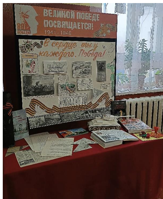
Рис.13 МБОУ «Шидловская ООШ»