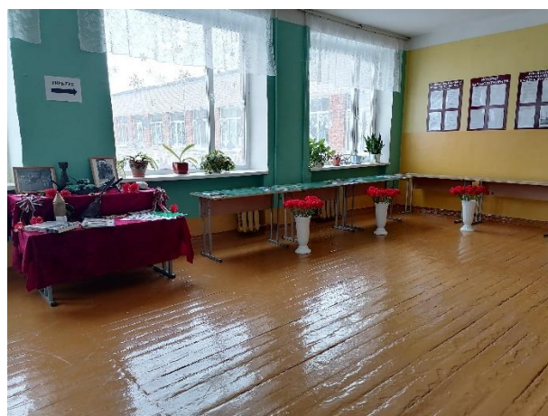
Рис. 4 МБОУ «Волоконовская СОШ №1»