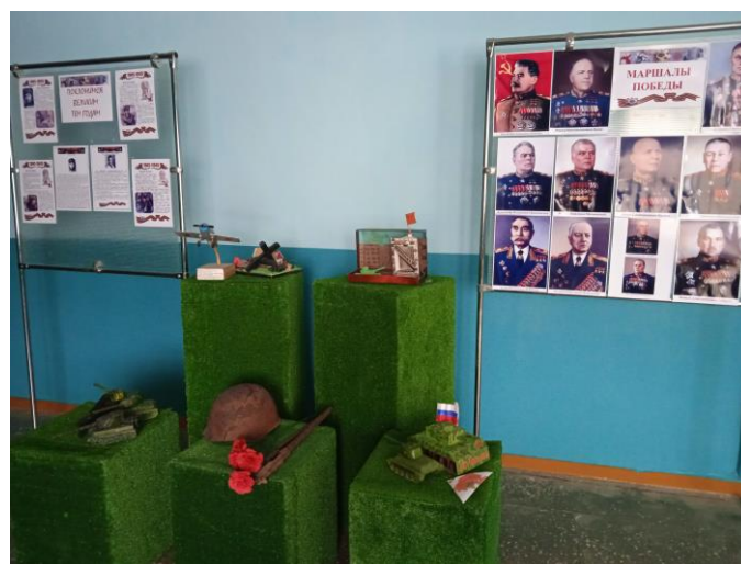
Рис. 3 МБОУ «Волоконовская СОШ №2»