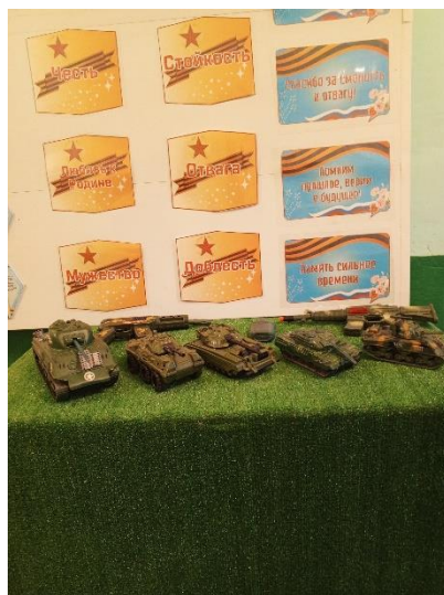
Рис. 14 МБОУ «Голофеевская ООШ»