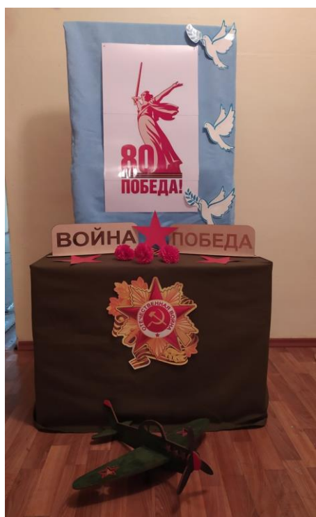
Рис. 7 МБОУ «Ютановская СОШ»