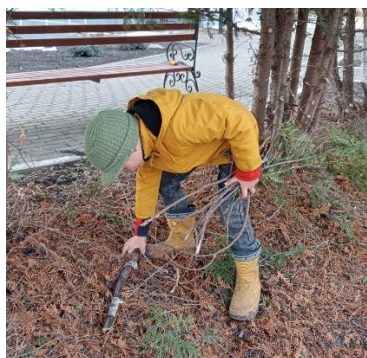
Рисунок 1 – 2. Обучающиеся творческого объединения «Вундеркинд» участвуют а благотворительной волонтерской акции «Рука помощи»: