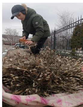
Рисунок 3 – 11.

Обучающиеся творческих объединений Центра детского творчества «Ассоль» помогают пожилым людям в уборке их придворовых территорий,