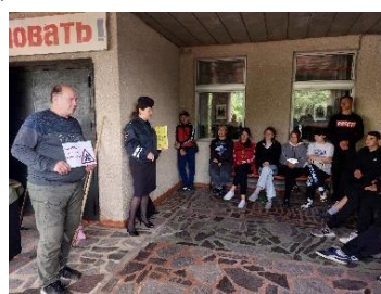
Рисунок 17 - 19. Проведение теоретических и практических занятий с обучающимися МБОУ «Волоконовская СОШ № 1», МБОУ «Волоконовская СОШ № 2», МБОУ «Ютановская СОШ» (с привлечением полиции).