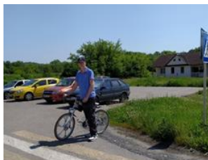
Рисунок 9 - 10. Проведение практических и теоретических занятий с использованием современного информационного оборудования «Азбука дорожного движения» для обучающихся МБОУ «Покровская СОШ», МБОУ «Шидловская ООШ».

Рисунок 7. Обучающиеся МБОУ «Ютановская СОШ» закрепляют практические навыки на дороге.