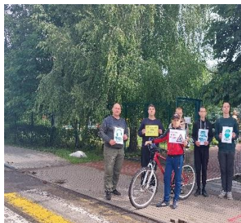
Рисунок 15 – 16. Проведение теоретических занятий с обучающимися МБОУ «Волоконовская СОШ № 1», МБОУ «Волоконовская СОШ № 2»