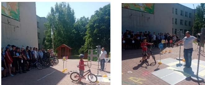
Рисунок 5 - 6. Обучающиеся ОГБОУ «Пятницкая СОШ» во время проведения практического занятия с использованием современного информационного оборудования «Азбука дорожного движения».

Рисунок 3 - 4. Обучающиеся МБОУ «Волоконовская СОШ № 2», МБОУ «Фощеватовская СОШ» во время проведения практического занятия с использованием современного информационного оборудования «Азбука дорожного движения».