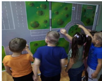
Рисунок 2. Практическое занятие с велосипедом на автогородке для обучающихся МБОУ «Погромская СОШ».

Рисунок 1. Обучающиеся МБОУ «Афоньевская ООШ» во время проведения практического занятия – работа с магнитной доской по ПДД.