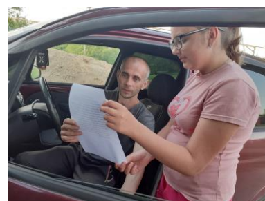
Рисунок 6 - 8. Проведение акции обучающимися МБОУ «Погромская СОШ» (изготовление буклетов с призывами соблюдения ПДД к водителям, пешеходам, велосипедистам):