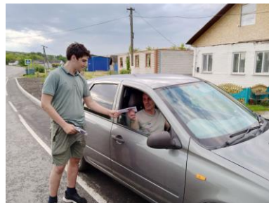
Рисунок 9 - 14. Проведение акции обучающимися МБОУ «Староивановская СОШ» (написание писем – обращений к водителям, пешеходам, велосипедистам):