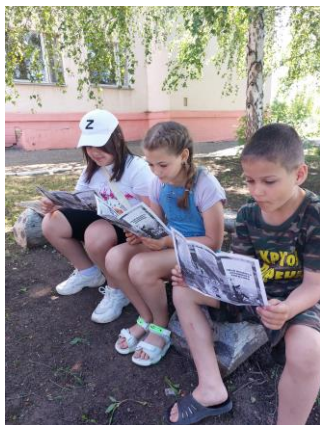
Рисунок 1 - 2. Проведение акции обучающимися МБОУ «Волоконовская СОШ № 2» (изготовление буклетов, раздача их прохожим):

Акция включала в себя следующее: разработка буклетов, листовок на тему: «Знать правила движения – большое достижение», «Знай правила дорожного движения!», «Правила соблюдать – беду миновать!»; написание писем – обращений к водителям, пешеходам, велосипедистам и т.д.; беседы с детьми на тему: «Знать правила движения – большое достижение» в онлайн формате.