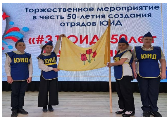
Рисунок 5. Творческая работы победителя в номинации «Лучшая фотография»:

команда ЮИД «Внедорожник» МБОУ «Волоконовская СОШ № 2