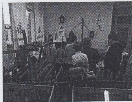
Рис. 3. Знакомство с народной традиционной культурой в МБОУ «Волоконовская СОШ № 1».