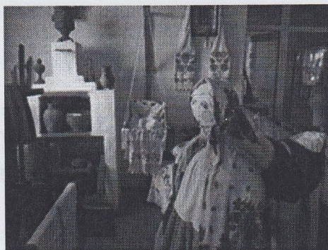
Рис.1-2. Обучающиеся МБОУ «Фощеватовская СОШ» в школьном музее.

Обучающиеся ознакомились с миром народной культуры.